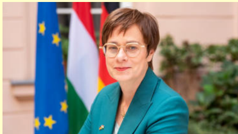
Botschafterin Julia Gross