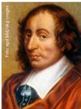
Der französische Philosoph, Mathematiker und Physiker Blaise Pascal (1623–1662; Sammelbild der Gutermann-Nähseidenfabrik um 1920).

Pascal hat den lebendigen Gott erfahren – Gott, der weder durch den Geist der Mathematik noch der Philosophie zu ergründen ist. Im „Mémorial“ heißt es unter anderem: „Jesus Christus. Ich habe mich von ihm getrennt. Ich bin vor ihm geflohen, habe mich losgesagt von ihm,