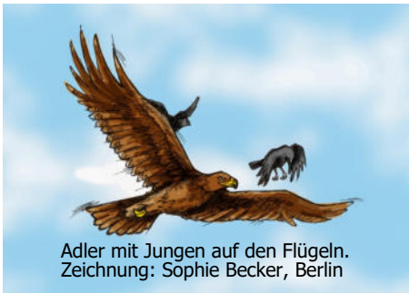
Adler mit Jungen auf den Flügeln. Zeichnung: Sophie Becker, Berlin